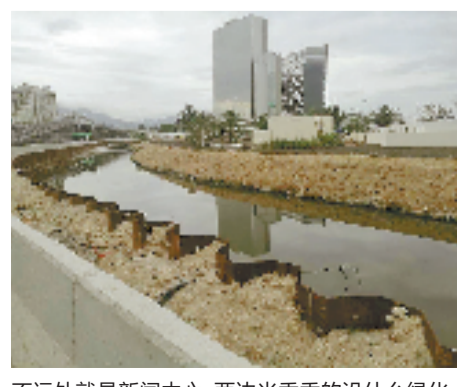
不远处就是新闻中心,两边光秃秃的没什么绿化。