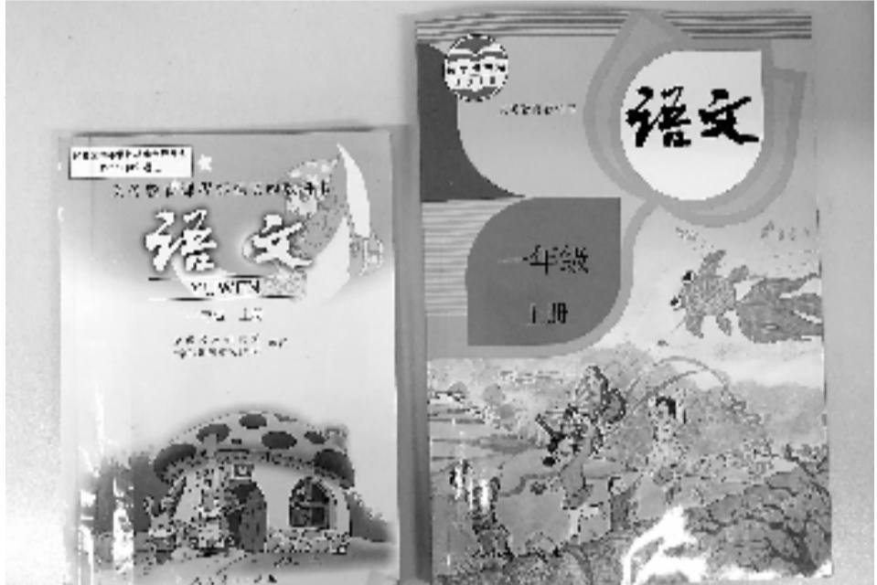
新版小学语文一年级课本(右),比老版大了不少。

至于新增的亲子共读栏目，王崧舟认为理念非常好，但是实际操作有难度。在真实生活中，有多少爸妈能做到共读？“这一点，应该是提倡，而不是搞一刀切”。