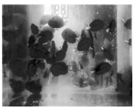
各种热带海水观赏鱼混游在一起。