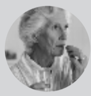
心脑血管问题频发