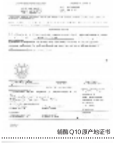
辅酶 Q10 原产地证书