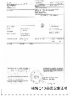
辅酶 Q10 美国卫生证书