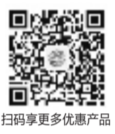
扫码享更多优惠产品