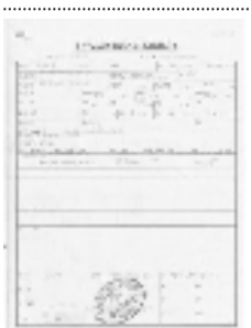
辅酶 Q10 报关单

秋季天气转凉、早晚温差大，不少中老年人出现心悸、胸闷、气短、乏力等问题，专家提醒，关爱心脏健康刻不容缓！