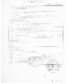
辅酶 Q10 进口食品批准证书