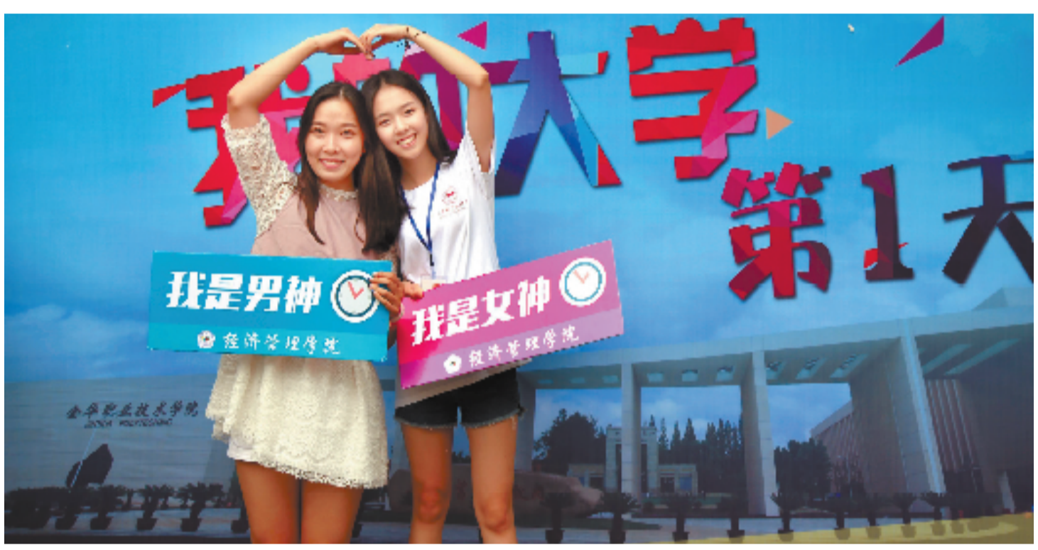
两名金职院新生在背景墙前留影。