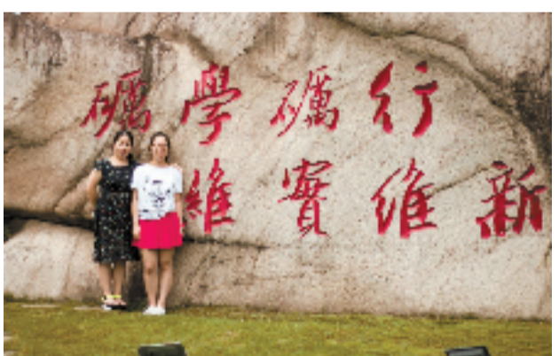
浙师大校园内,一名新生与母亲在校训石前合影。

把大学唱给你听、写一封信给三年后的自己、选择一个标签合影……学长学姐们精心准备的各种欢迎节目,让初次跨进大学校园的新生们直呼“太热情了!”