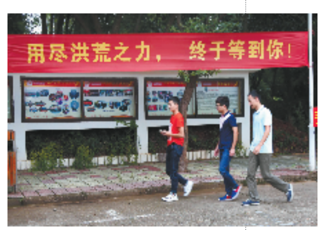
校园内到处都是迎新的横幅。