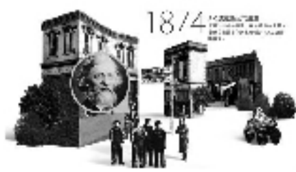
“工匠精神”的142年传承

142年,对于A.O.史密斯公司来说,意味着历史,意味着荣耀,更意味着“工匠精神”的传承。在A.O.史密斯公司,“通过研究,寻找一种更好的方式”,就是“工匠精神”的具体演化。A.