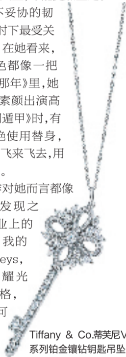
Tiffany & Co.蒂芙尼Victoria 系列白金镶钻钥匙吊坠

生活和工作对她而言都是自我探索的发现之旅。无论是事业上的尝试,还是对自我的探寻,Tiffany Keys,看似简单却闪耀光芒,唤醒自我风格,未来才有无限可能。