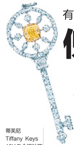
蒂芙尼 Tiffany Keys 18K白金镶钻花 瓣形钥匙吊坠