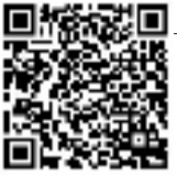
小籽货野山参 扫码抢购买5送1

“哇，这参真便宜，还是杭检认证的，3333689还在吗？” “老姜的人参我吃了三年了，别看小籽货味小一点，力道还是很大的，没想到今年杭检参也这么便宜，当然要过来抢几支！” “每年冬天吃，点人参好的，四五百块钱一支的杭检参，我们自己退休工资也吃得起，买个5支吃一个冬天，划算得很！” “本来想买杭检参的，但是到了门店一看，竟然还有50年的高龄野山参，参须清秀不乱，又拧，又坚韧，又结实，一看就是好东西啊！”