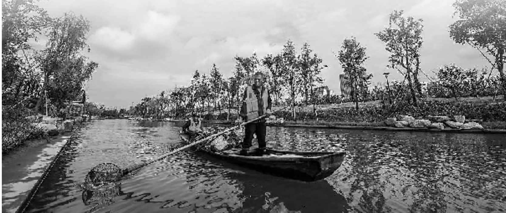
《河道美容师》作者:刘年