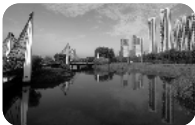
《碧水金隅》作者:杨甬杭