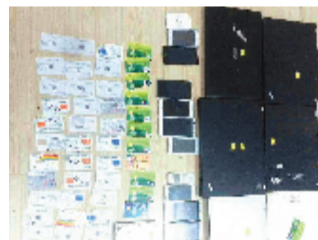
缴获的部分涉案物品

最令人气愤和不齿的是,在这些犯罪嫌疑人当中,还有个别银行和机关单位的工作人员,参与了贩卖公民个人信息、银行账户信息等,成为整个犯罪链条中不可缺少的重要一环。