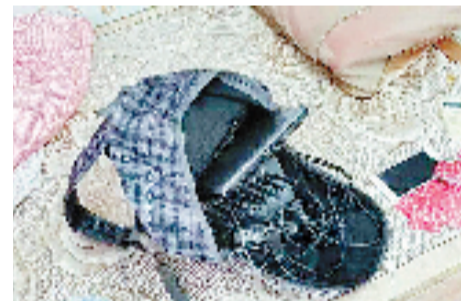
缴获的部分涉案物品