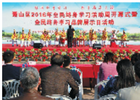
民终身学习活动周以来,今年已经是第12次。 王晨晨/文