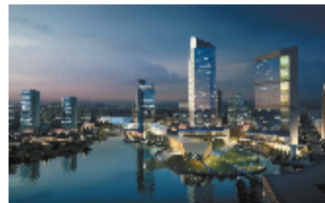
张江平湖科技园效果图