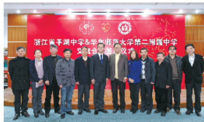
平湖中学和师大二附中签约