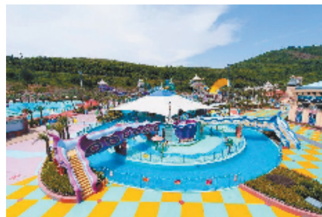
平湖九龙山旅游度假区

“这条线路开通了真好,以后到金山去就方便多了。”今年10月20日起,新埭至金山北高铁公交专线K319路正式开通了,前来乘车的市民纷纷发出了这样的感叹。同