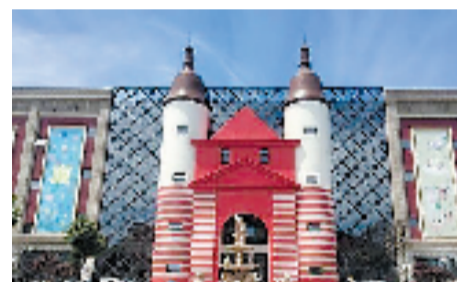
浙商回归项目平湖·进口食品城