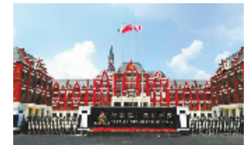
平湖枫叶国际学校