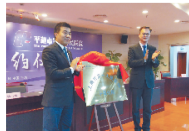
平湖一院和上海一院签约