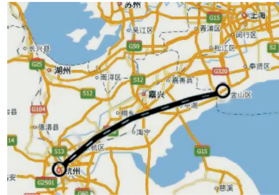
沪乍杭铁路路线图