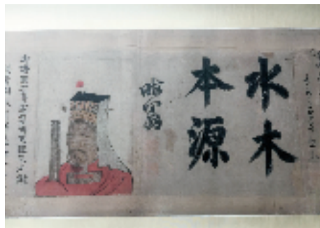
朱熹题字“水木本源”