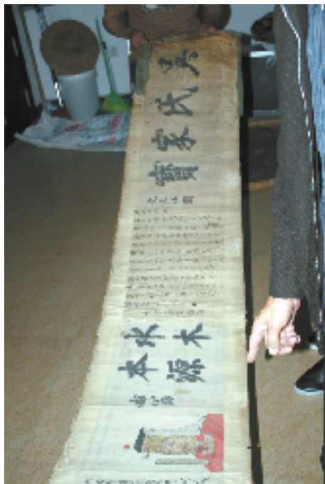
10余米长的吴氏家宝原件

在中洲镇札源村,县档案局(馆)的工作人员发现了一部从不外露的“吴氏家宝”。札源村的村民大多数姓吴,村中有古老的吴氏宗祠,村民们一直以吴氏家宝为荣。