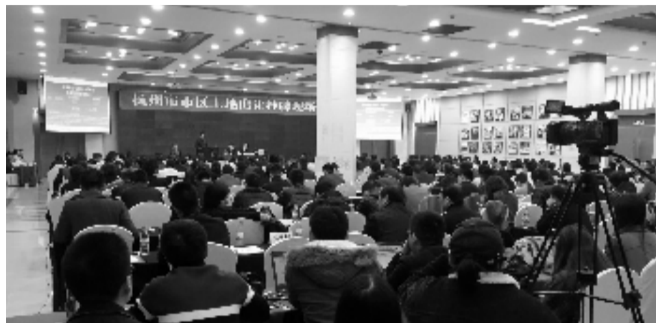
11月28日 杭州土拍现场。

最后,良山新城核心区西地块为商住用地,面积11.4万m 2 ,总起价约38亿元,起拍楼面价15570元/m 2 。该地块无疑也是大热门地块,11月28日,核心区东地块出让引来了近20家房企报名,最终由越秀集团以25787元/m 2 的楼面价斩获,这宗相邻的核心区西地块最终价格是否会超越核心区东地块?将由谁拿下?都将作为看点。而越秀集团内部人士明确答复记者:“会继续参与竞拍。”