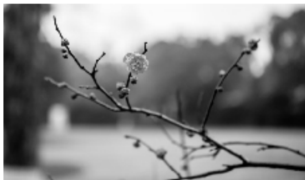
孤山梅花迎新年