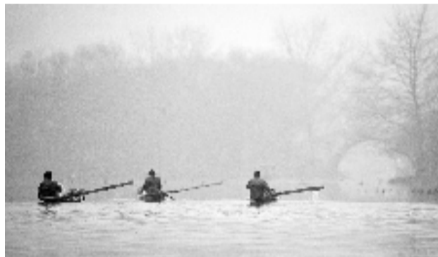
晨捕归来 杭州老潘 摄