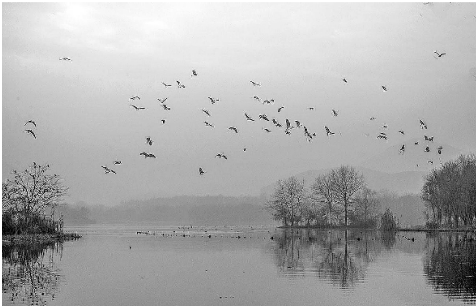
清幽与喧闹