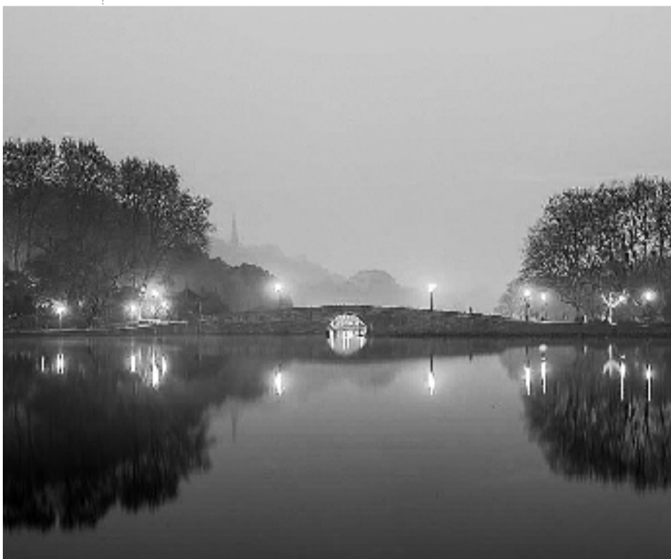
轻烟薄雾笼西冷