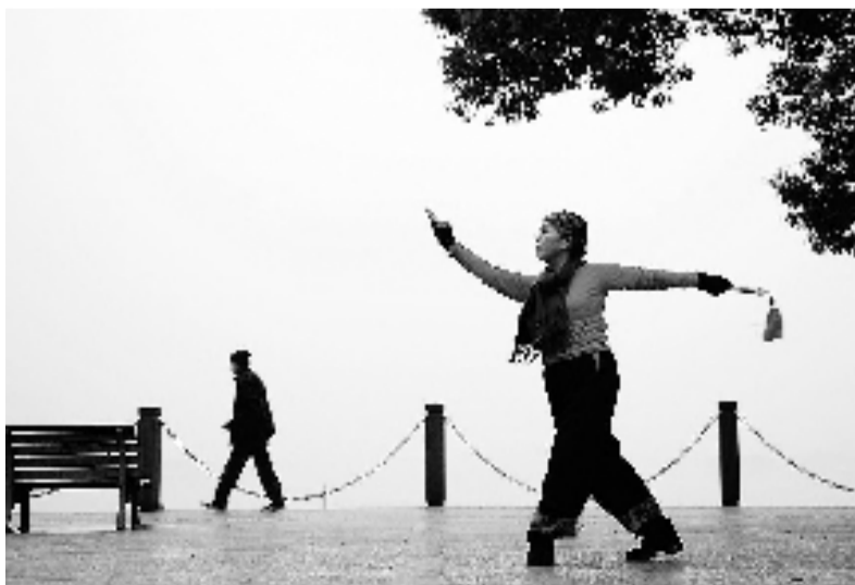
冬日晨练