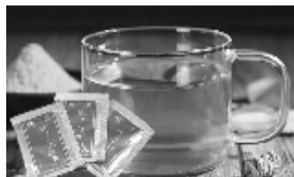
随时冲泡，轻松保健，一天仅需一包

现在吃铁皮枫斗晶的人越来越多，也使得越来越多的热钱涌入铁皮石斛行业。据不完全统计，单是浙江就有近百