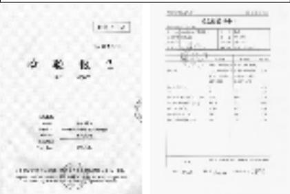
雁荡山铁皮石斛原料 铁皮石斛颗粒(枫斗晶) 检验报告 成品检验报告