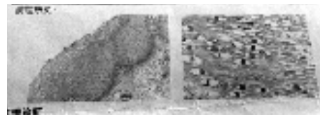
2016年11月24日第二张病理报告