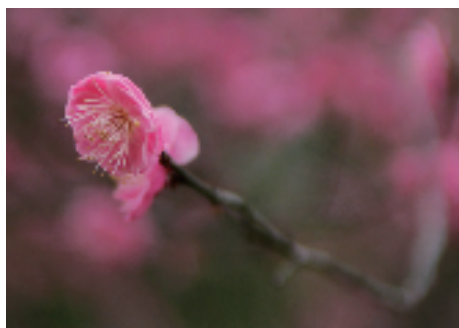
市区梅园里,春色满园,朵朵红梅报春来