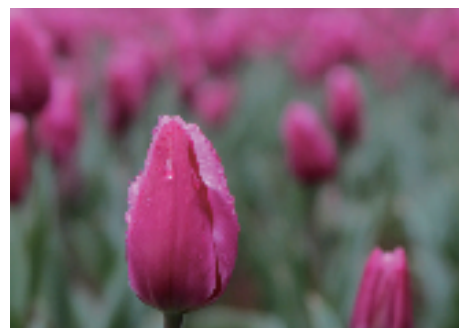
市区燕尾洲公园里,亭亭玉立的郁金香犹如含情脉脉的少女

风轻盈,鸟语花香,走进春天的时光里,心情是喜悦的,是轻快的,是明媚的,也是温暖的,荡漾在二月的时光里,悄然欣喜,陌然喜欢。