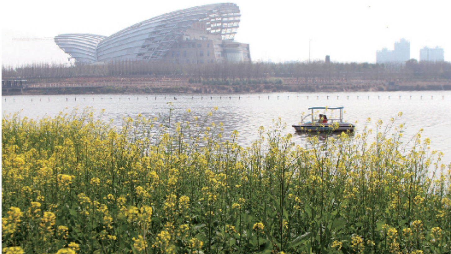
市区婺州公园里,大片金灿灿的油菜花迎风曼舞醉游人