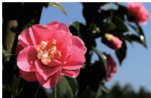
市区茶花物种园里,赛似牡丹的金华茶花