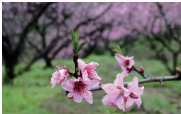
金东区源东乡万亩白桃基地的桃花开始漫山遍野开放