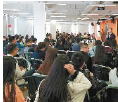
活动现场，相亲者手里都握着手机。

而一位1993年出生的小金姑娘给出了另一个说法：“其实，我们现在相亲，都肯定是先看颜值的，一定要找个对自己胃口的呀。现场看看如果没有人合眼缘，我就觉得不要乱搭讪了，万一人家有想法怎么办？所以低头刷刷手机就好了。”