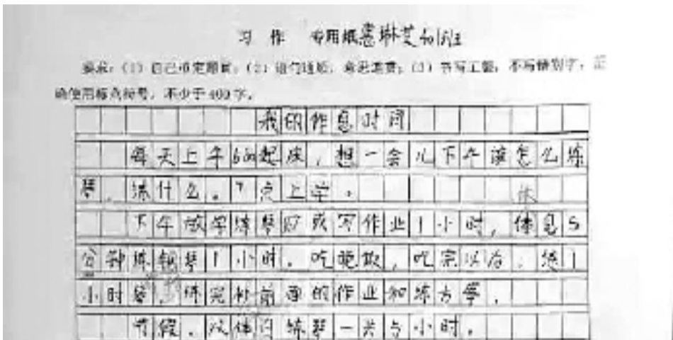
上图:惠琳芝的作息表。