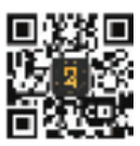
财经圈 扫一扫二维码 了解财经大事

继前天下跌11%后,昨天美图股价又大幅波动,盘中一度涨幅超过7%,但收盘下跌8.64%,报14.60港元。目前美图公司市值617亿港元,较前天最高峰的974亿港元,下跌了357亿港元。