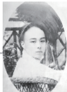
父亲大人膝下稟者：

男游杭四载，所费钱财实多，大人之汗血，而大人之望于男者，因切而且深矣。然而时丁厄运，中原逐鹿，人心思乱，揭竿而起者随处可见。男既为军人，不能不从事于戎马，惟兵凶战危，不能料其必胜，亦不能预知不死。万一男能出九死于一生，则当再养大人而尽孝道。不然，若从此久别，则四弟长大尚足以奉养父母而嗣后也。倘男得天之佑，蒙祖宗之庇，尽国民之义务，实亦终身愿也！