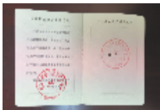
食品安全管理员证