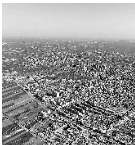
俯瞰河北省容城县县城(4月1日摄)

设的典范。要保持历史耐心,尊重城市建设规律,合理把握开发节奏。要加强对雄安新区与周边区域的统一规划管控,避免城市规模过度扩张,促进与周边城市融合发展。各有关方面要按照职能分工,密切合作,勇于创新,扎实工作,共同推进雄安新区规划建设,为实现“两个一百年”奋斗目标和中华民族伟大复兴的中国梦作出新的更大贡献。