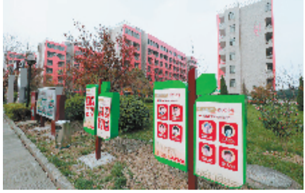
在平湖衡中展示的衡水中学历届高考状元