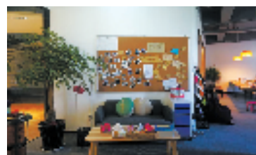
尚+空间“尚书房”休息区