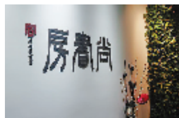
尚+空间“尚书房”一角