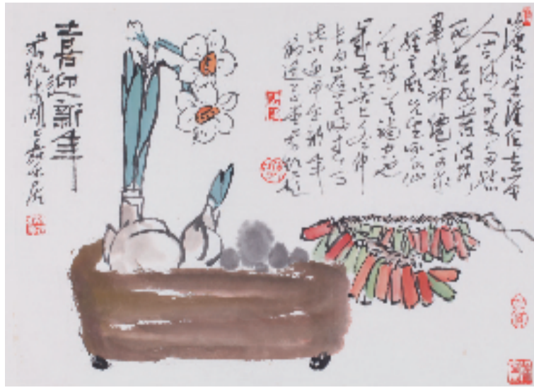
（作者：洪天雨，原名洪校生，曾任富阳日报副总编、浙江富春江书院副院长，现为中国王羲之书画研究院浙江分院副院长兼学术理论部主任、浙江当代中国画院院务委员、书法创作室副主任（研究员）、浙江民建书画院艺术顾问、杭州市富阳区作家协会名誉主席、富阳区美术家协会顾问、黄公望书画艺术研究院院长。）