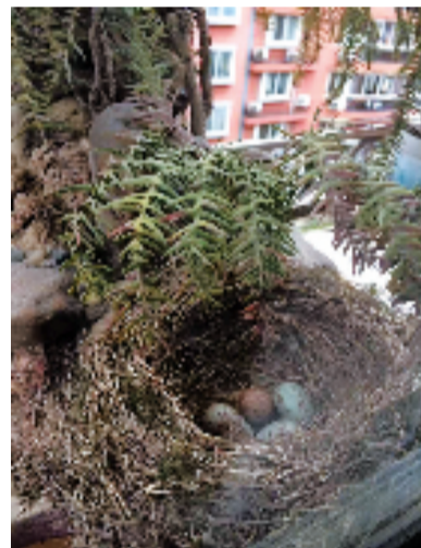
乌鸫五天生了5颗蛋