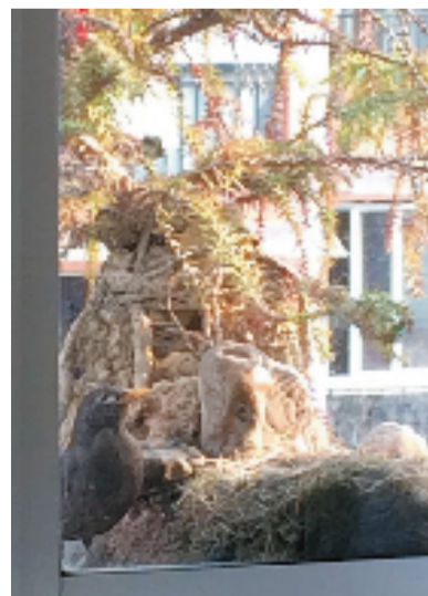
大鸟时常会在巢边看管鸟宝宝