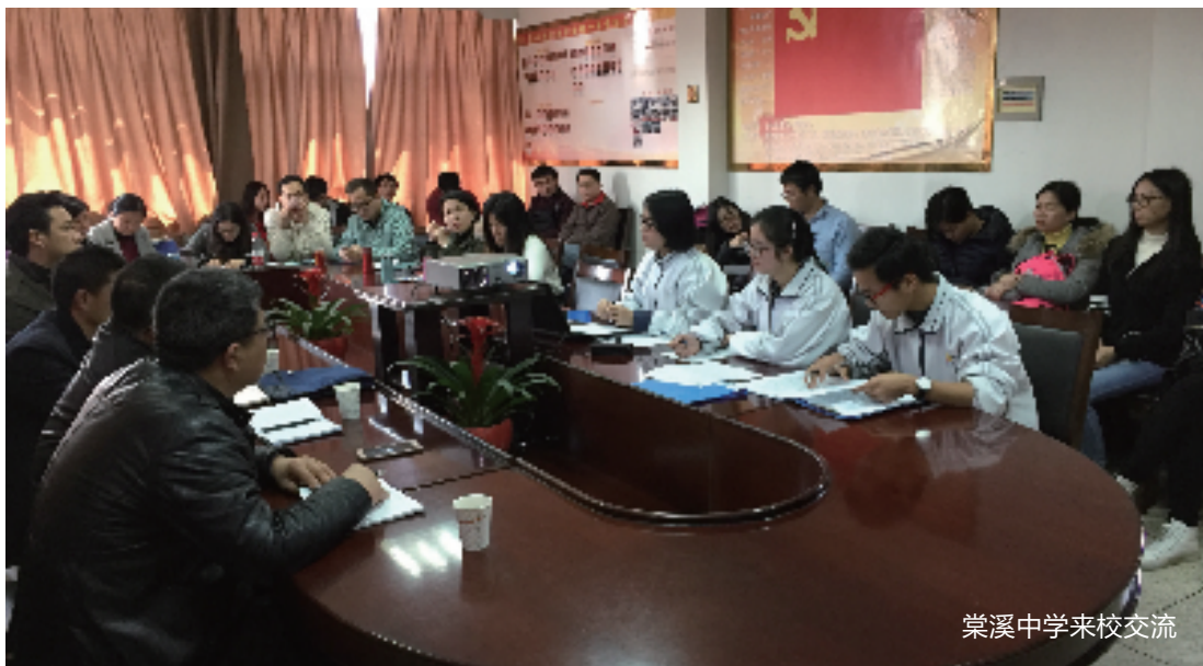
崇溪中学来校交流