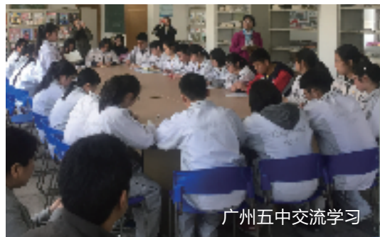
广州五中交流学习