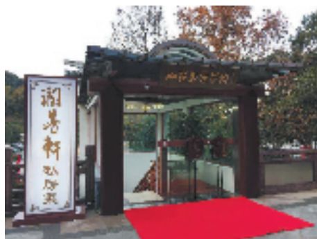
润芳轩山庄私房菜馆

美景醉人,美食则是将人们从沉醉中唤醒的“兴奋剂”。超山周边有数十家饭店,专营农家菜,历经数年,已形成当地独具一格的杭帮菜口味。其中最为独特的当属润芳轩土菜馆,它是一家隐于超山自然风光中,文化气