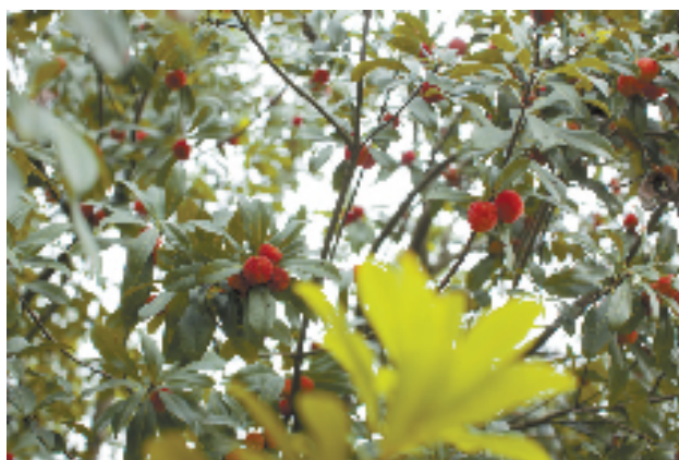
超山杨梅 最佳采摘季:6月中旬-7月上旬