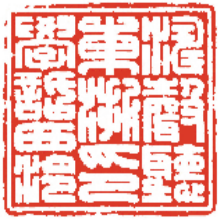
涛声听东浙印学话西泠