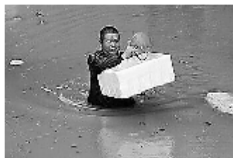
暴雨中他们托着泡沫箱、塑料箱,转移被困孩子。