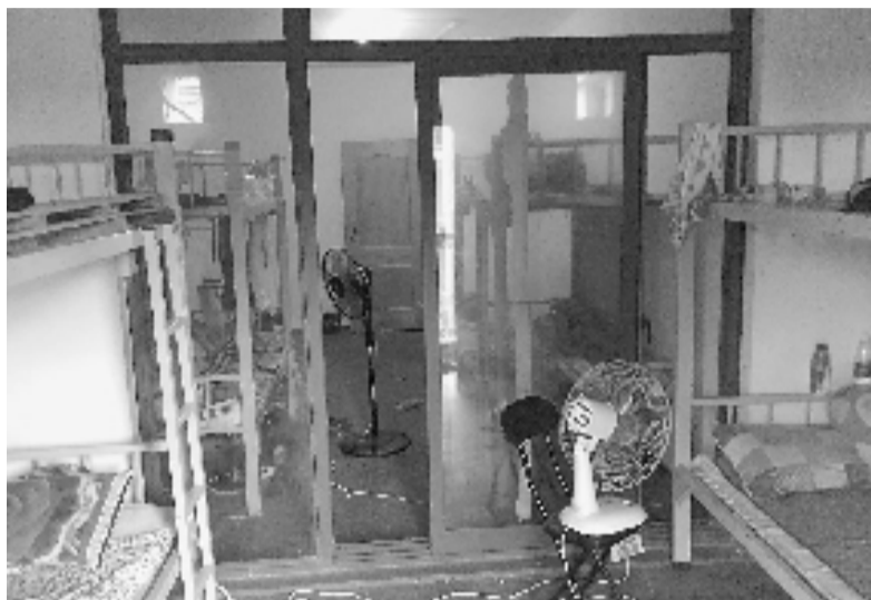
六楼的每个房间都摆了两张高低铺