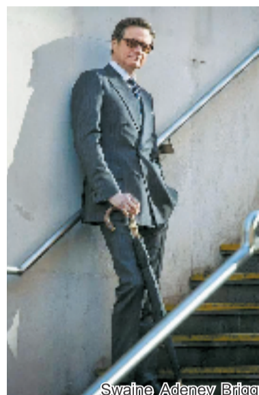
Swaine Adeney Brigg

Fox Umbrellas 不同于大部分以伞面材质定价的雨伞品牌,Fox 以伞杆或手柄的材质工艺区分价格,主要分两种,一种 Stick 是指伞杆和手柄都是木质,但是由分开的两块木头拼接而成,可拆分,手柄也可以根据喜好更换;另一种 Solid 则是伞杆和手柄完全为一根木头打造,强度足够支撑人体重量可作为手杖使用。