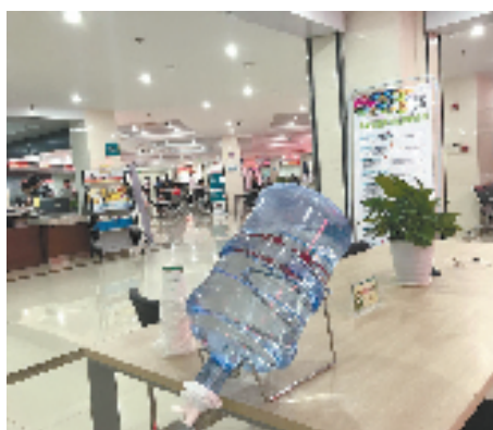
免费提供饮水服务