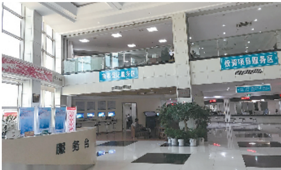
整洁明亮的办事大厅