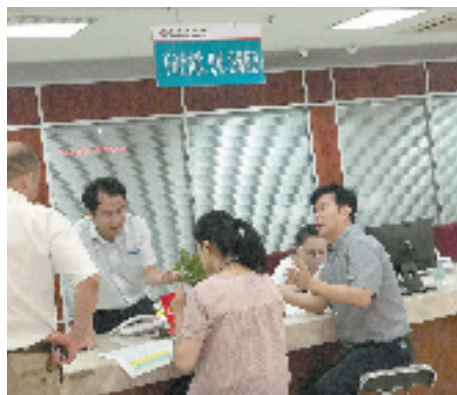
耐心有礼为市民解答