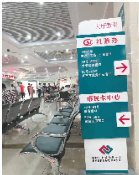
一目了然的指示牌

近日笔者从县行政服务中心获悉,自8月26日起,桐庐行政服务中心之“市民之家”双休日开放,俗称“周末不打烊”。期间主要是办理市民关注度高、办件量大的服务事项。消息一经发布,广受市民的好评,纷纷留言“人性化、非常棒”,并点赞。