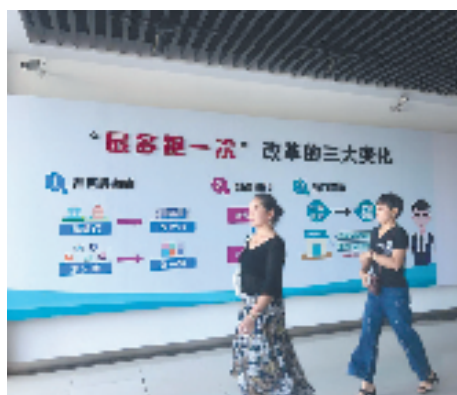
办完事的市民满意离开