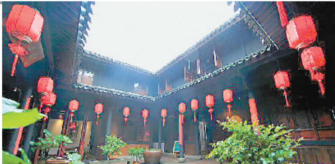
鸣鹤古镇小五房,现在是养生茶楼。