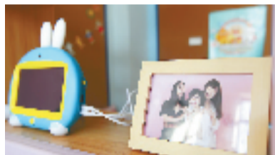
三位餐厅创始人都是年轻的妈妈,对小孩子吃的东西特别看重