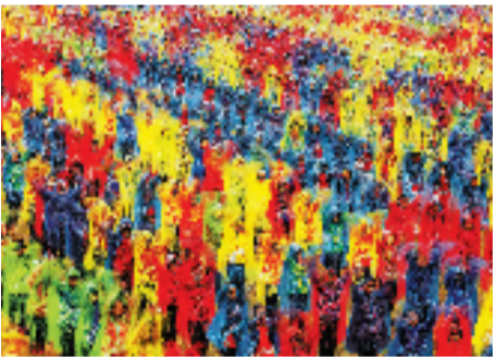
《万人同舞》 获2016年浙江省第16届摄影艺术展优秀奖