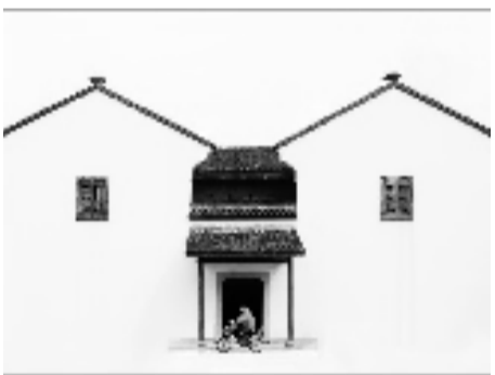
《岁月时光》 获2016年全国古建筑摄影传承类大赛优秀奖