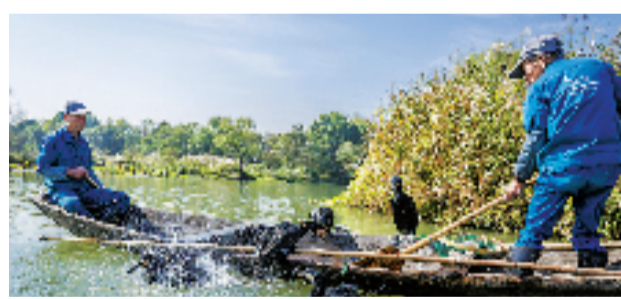
芦花开鸬鹚欢

名额真的很紧俏哦，告诉你报名方法：第一步加好摄之友官方微信。第二步在微信对话框输入关键词：干塘，即可进入报名页面，提交信息。速速报名吧。今天能接到通知的，说明你入选了！ 本报记者 陈艳 通讯员 周莹