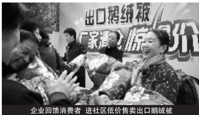
企业回馈消费者 进社区低价售卖出口鹅绒被

对于本次甩卖活动,邢总介绍道,因为成本高昂,这次活动只销售一万条,一万条售完立即恢复原价,绝不再追加。利用这个时间,我们现在也在和国内的经销商在接触洽谈,一旦国内市场的销售渠道打开,我们就马上恢复正常销售。同时也借这次清仓活动,打响口碑,更好的开拓国内市场。