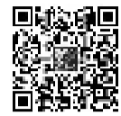
扫一扫 看更多美图

周子楠的个人摄影展,从现在起一直会展览到新学期。可是她的摄影之路,还将继续。 本报记者 陈艳