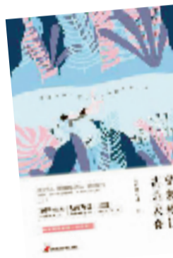
醒来觉得甚是爱你

明天就是大寒了。古语云:寒气之逆极,故谓大寒。在这个寒意最浓的时候,捧一杯暖暖的茶,读一本暖暖的书,简直完美。今天,推荐几本适合在寒冷冬夜阅读的书,愿它们能为你带去浓浓暖意。