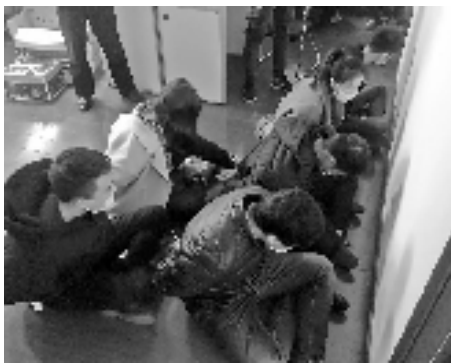
被抓获的犯罪嫌疑人。