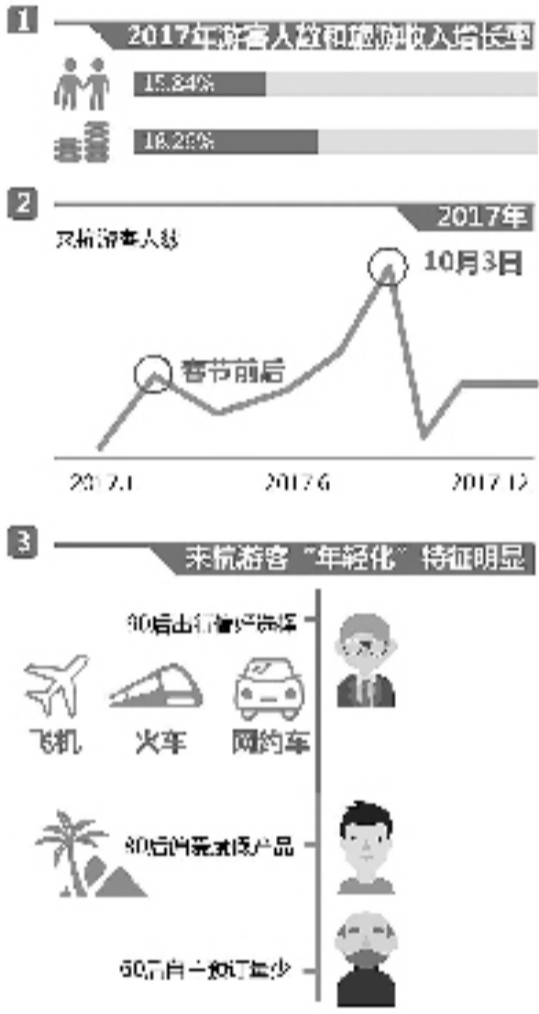
图说:数字城市 美好旅行

2017年,杭州旅游大数据平台与线下各大景点、酒店、商业综合体及线下与旅游行业相关的互联网公司开展数据合作,将酒店点评数据、商圈消费数据以及总体客流等宏观数据与企业的微观经营数据进行共享整合,给大家带来了不一样的旅游数据体验。