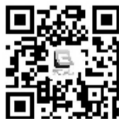
扫描二维码 进入“城市日历” 体验奇妙旅程

记者了解到,本次发布会还通报了《2017杭州旅游主要经济指标完成情况》和《2017杭州旅游年度大数据报告》,为我们揭开了杭州旅游的年度数据全貌。