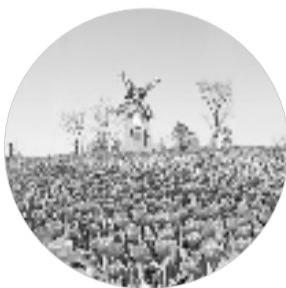
云澜湾四季花海乐园