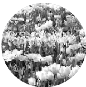
会稽山郁金香花海