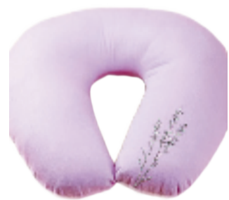
云小南 薰衣草U型护颈枕 有礼价：89元/件

云小南薰衣草U型护颈枕选用纯天然的优质薰衣草为原料，香气恬静优雅，芳香助眠。无论是日常办公小憩，或是旅途出差，都能带给你如影随形的放松感受。