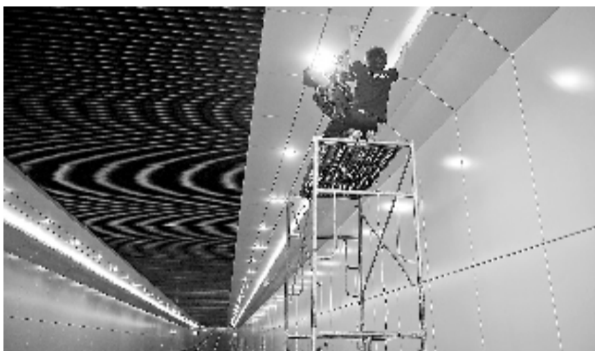
隧道扫尾工作进行中

金沙湖于今年年初完成注水,湖体面积464亩,相当于西湖北里湖的90%,与纽约中央公园湖面相近,成为杭州最大的人工湖。到2020年底,金沙湖将升级成一个大景观公园,总占地面积有970亩,相当于90多个足球场。根据规划,金沙湖的东南角和中间区域,将建设成一个大草坪,配植乔木,方便大家来健身、散步、拍婚纱照,北面将会打造成一个高端的商业中心。