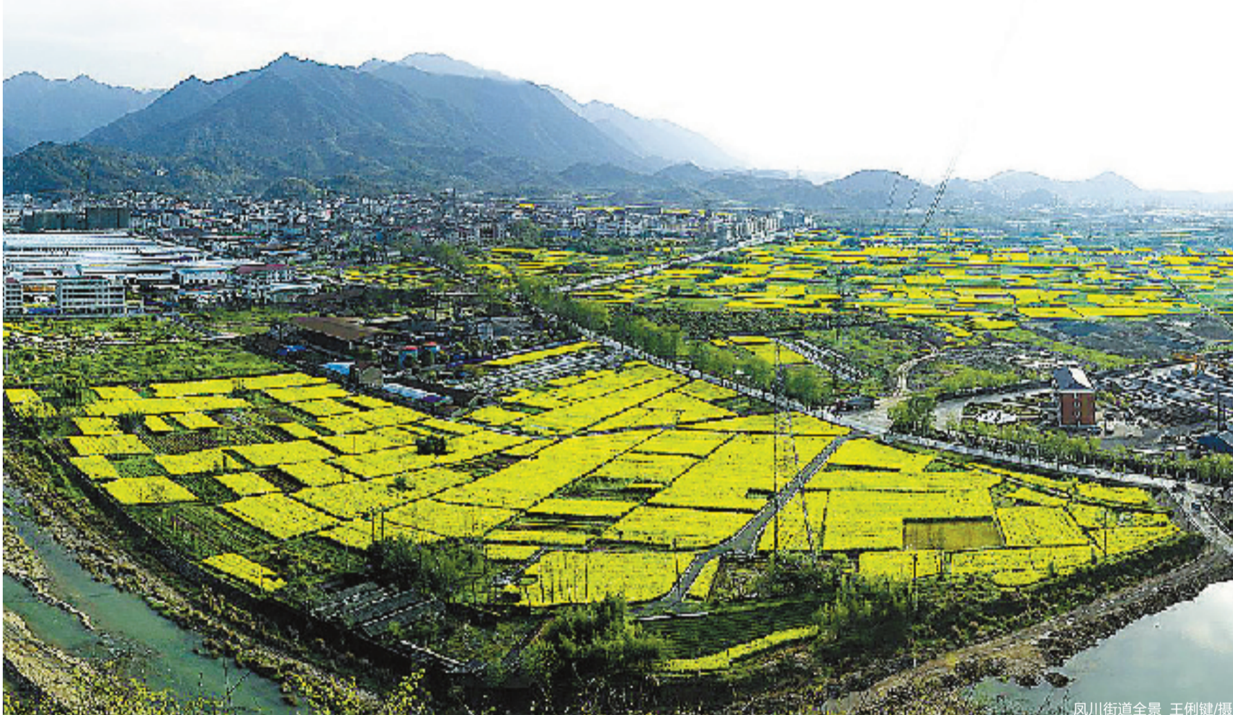
凤川街道全景

“美丽乡村”桐庐先行,在不断探索中积累了农村发展宝贵经验的桐庐乡村,如今是景观特色型、古村落文化体验型、乡野田园型、农业特色型、高端华丽型……一个个田园综合体如同雨后春笋般出现,正在为全国提供样本和经验。本期《乡村振兴路上的桐庐》特别报道推出第一篇:《凤川人的乡村振兴愿景将一步步变成现实》,详见第三版。