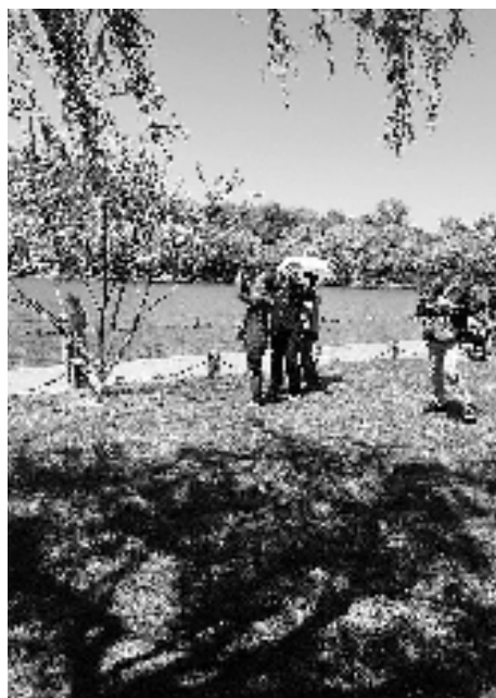
游人踏进草坪拍照