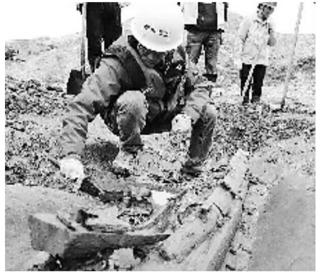
四川江口沉银遗址考古现场。

这26项考古究竟牛在哪里?请关注“浙江24小时”APP全文栏目,查看浙江省文物考古研究所研究员方向明和钱报记者独家辣评。