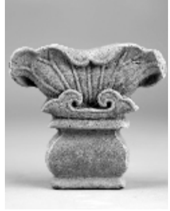
绍兴兰若寺墓地建筑构件。