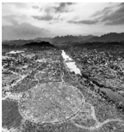
衢州石梁花海