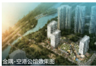
金隅·空港公馆效果图